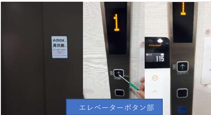
エレベーターボタン部