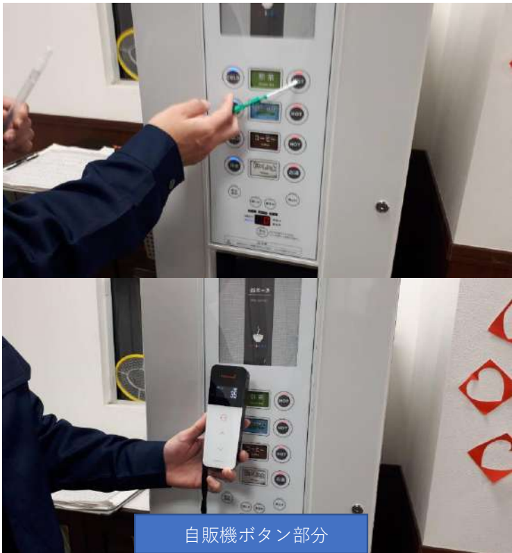
自販機ボタン部分