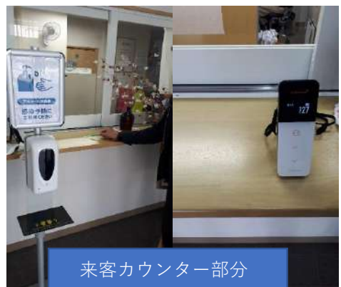
来客カウンター部分