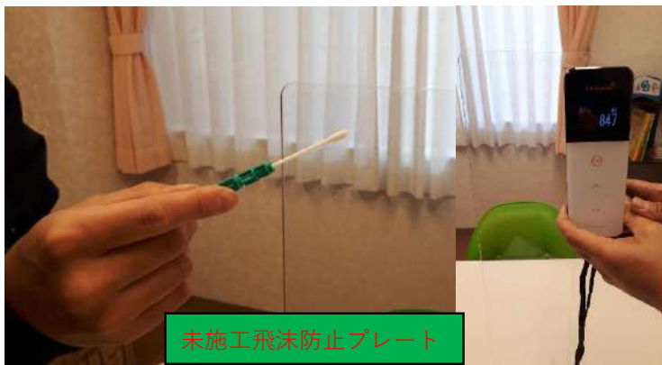
未施工飛沫防止プレート