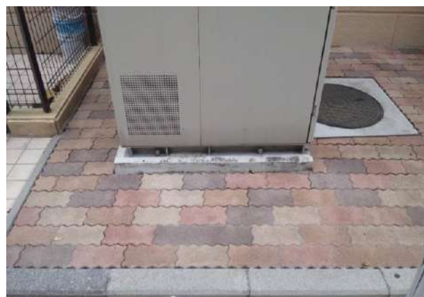
インターロッキング部分