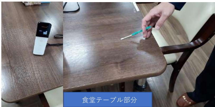
食堂テーブル部分