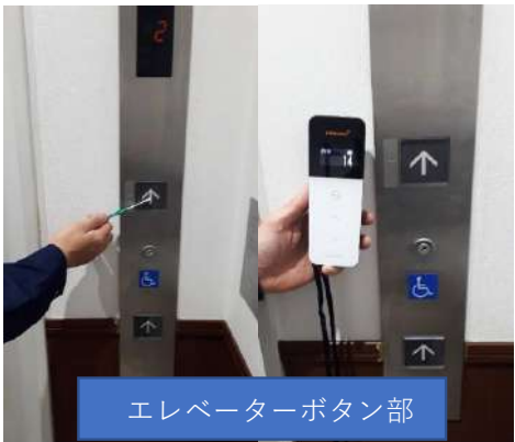
エレベーターボタン部